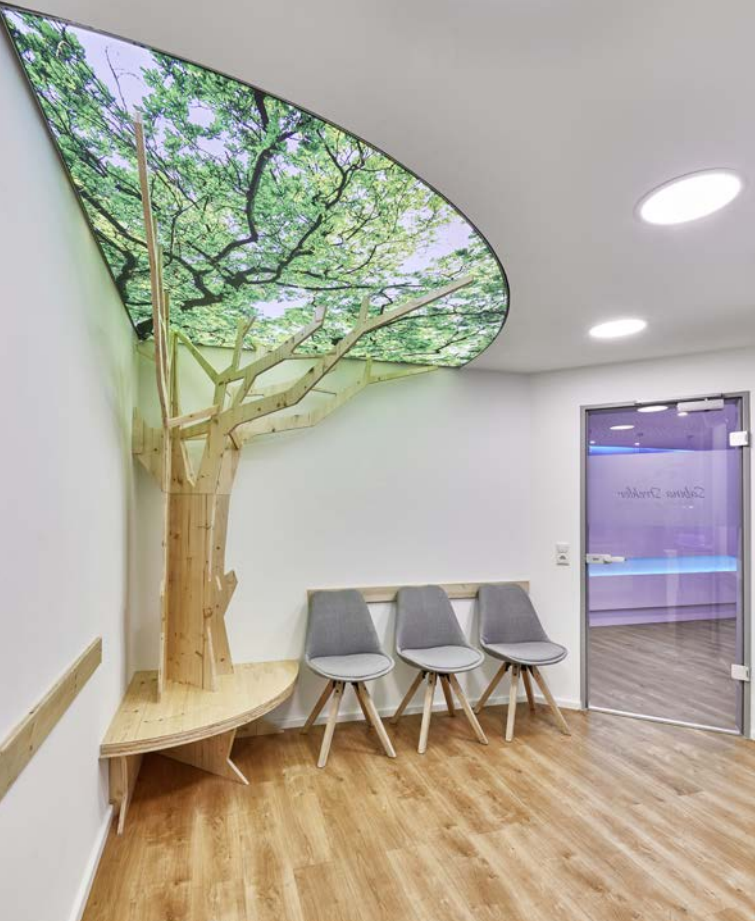
Abb. oben: Als atmosphärisches Element und Ergänzung zu den opaken Downlights wurde im Wartebereich ein hinterleuchteter Spanndiarmen installiert, der eine Baumkrone zeigt.