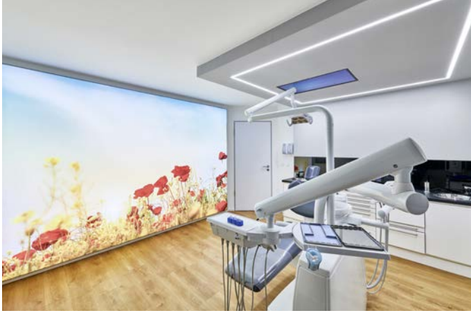
Abb. oben: In den Behandlungsräumen wählte man als Grundbeleuchtung ein Quadrat aus homogenen Lichtlinien. Der Spanndiarahmen wird mit unterschiedlichen Naturmotiven bedruckt und leuchtet vollflächig in Tageslichtfarbe (6500 K).

Als Kombination zur Grundbeleuchtung wurde auch hier als Highlight in jedem Behandlungsraum ein wandfüllender ca. 3m x 3m großer Spanndiarahmen mit einem Naturmotiv eingesetzt. Die LEDs in Tageslichtfarbe (6000 K) und einem Lichtstrom von insgesamt 46.000 Lumen sind auf einem weißen Aluminiumblech aufgebracht und mit einem textilen Spanntuch mit Digitaldruck überzogen. Die vollflächig hinterleuchteten Spanndiarahmen zeigen in jedem Raum ein anderes Naturmotiv – ein Fotoausschnitt eines Waldweges, im nächsten Zimmer der Ausschnitt eines Sonnenunterganges in einer Blumenwiese und im dritten Behandlungsraum einen Strandabschnitt und die Weite des Meeres. Hier wird der Eindruck vermittelt, man liege direkt in der Natur oder schaue durch ein übergroßes Fenster in die Ferne. So ist der Patient entspannt und abgelenkt und genießt das stressfreie Ambiente. Das Highlight sind die in die Decke eingelassenen Monitore über den Behandlungsstühlen. Hier können Filme abgespielt werden und mit entsprechenden Kopfhörern kann der Patient während der Behandlung einen Film genießen. Bei großen und kleinen Patienten sorgt dies für großen Anklang.